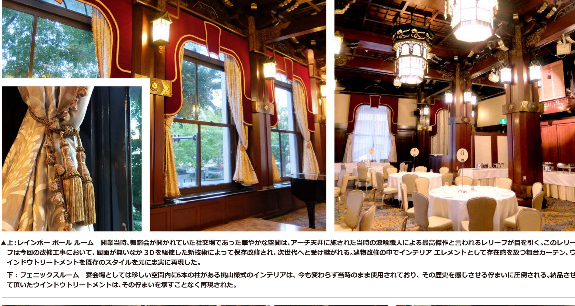
▲下：フェニックススルーム 宴会場としては珍しい空間内に6本の柱がある積山様式のインテリアは、今も変わらず当時のまま使用されており、その歴史を感じさせる佇まいに圧倒される。納品させて頂いたウインドトリートメントは、その佇まいを壊さず再現された。