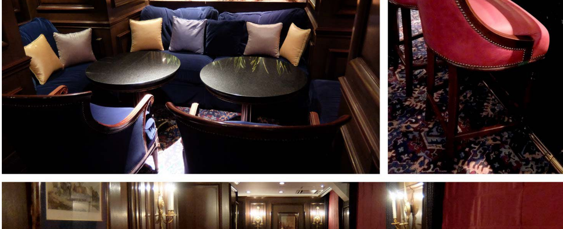
▲バーシーカーディアンⅡ 英国調スタイルの正統派バーは、大人の社交場としてふさわしい重厚な雰囲気。ヘルベットのブルーにリベットが映えるチェアやソファ、赤い皮革張りのスツールは張り替えと装飾カーテンを納品。