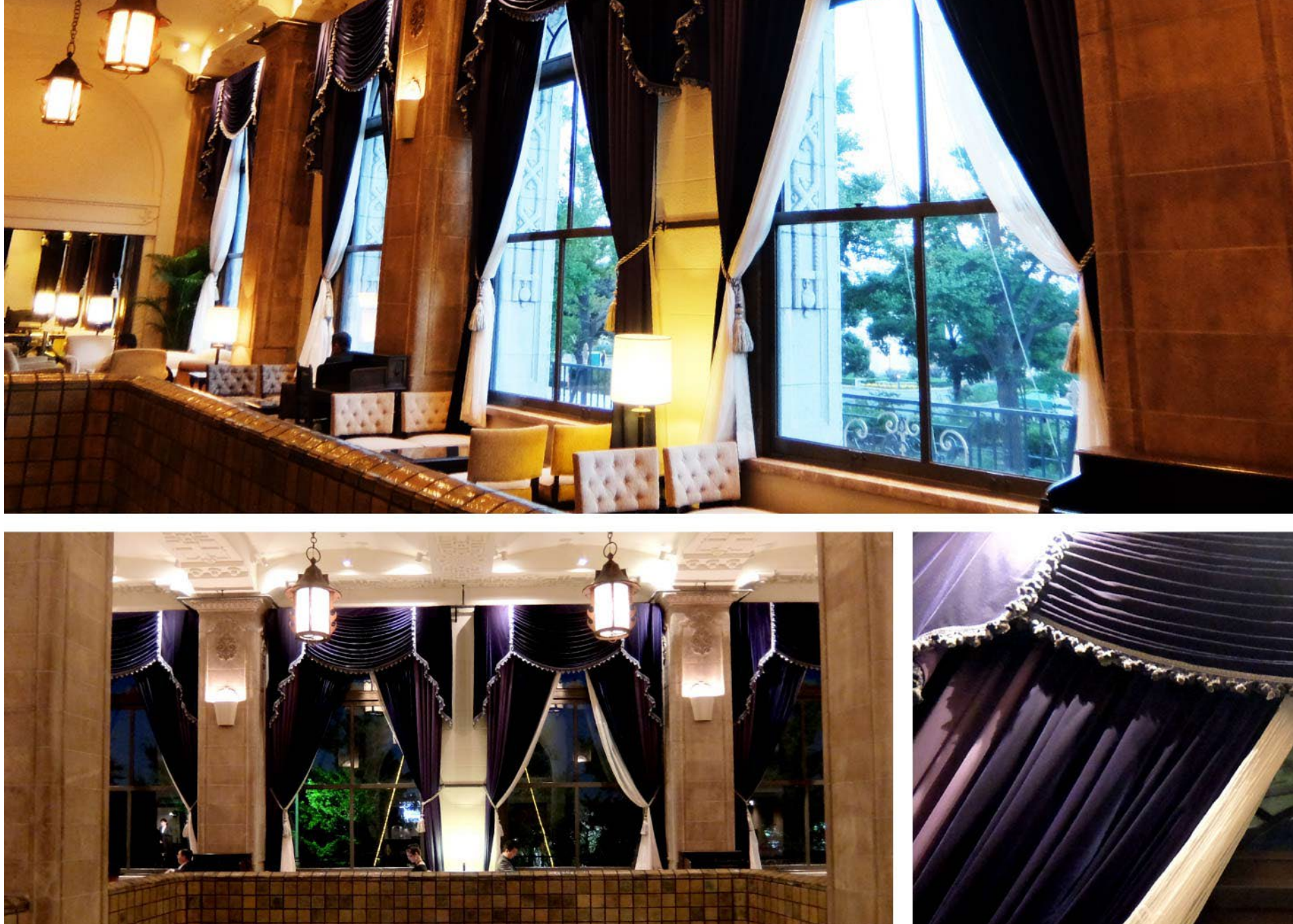
▲本館ロビー 歴史あるロビーの風格に合うトリムが備えられ、カスケードが美しい深いブルーのドレープは、既存のウインドトリートメントスタイルを再現したものです。

横浜・山下公園前に位置する「ホテルニューグランド」は、1927年に開業して以来多くの人に親しまれてきました。本館は銀座和光などを設計した渡辺仁によるもので、1992年には横浜市認定歴史的建造物となった、日本におけるクラシックホテルの代表格です。今回、建築耐震工事を含む大規模改修が行われている中で、インテリア改修のお手厚いさをさせて頂きました。