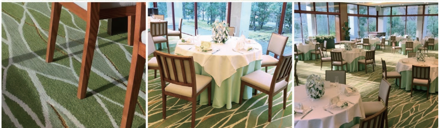
▲周りを囲む、緑と光を表す特注柄 OMT カーペット。ループの表現を交え、流れるようなグリーンがすがすがしく落ち着いた印象に。