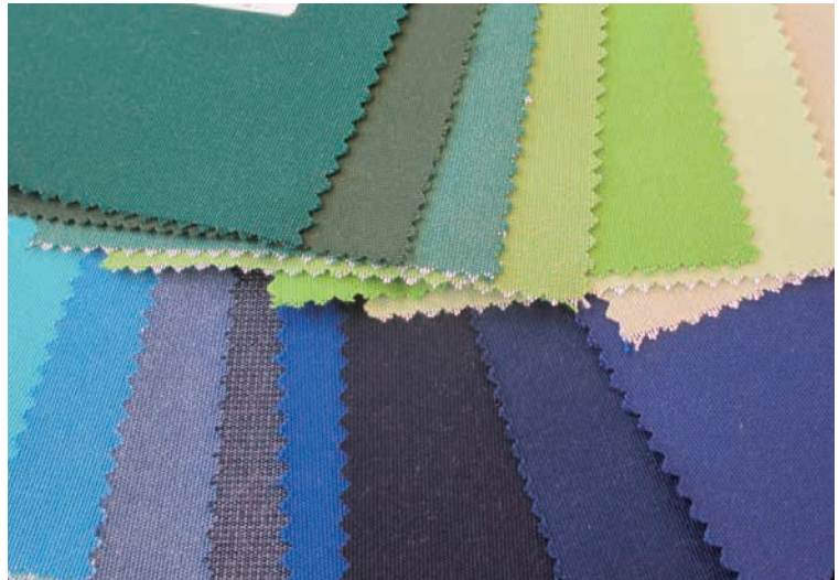
▲Casal : フランスならではの絶妙な色とバリエーションが楽しい。100%原着アクリルを使用。