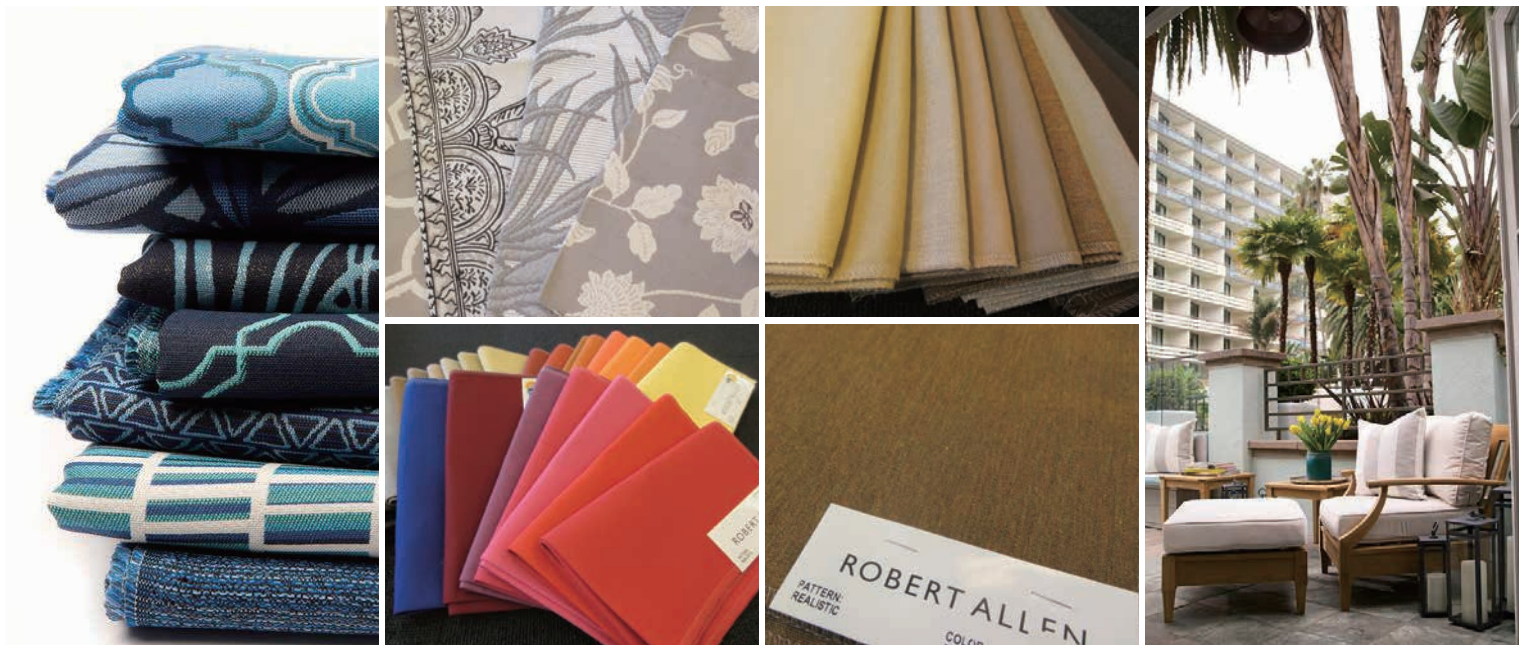
▲平織だけでなく、テクスチャー感のあるダイナミックなパターンや、ソリッドタイプはカラーバリエーションが豊富。