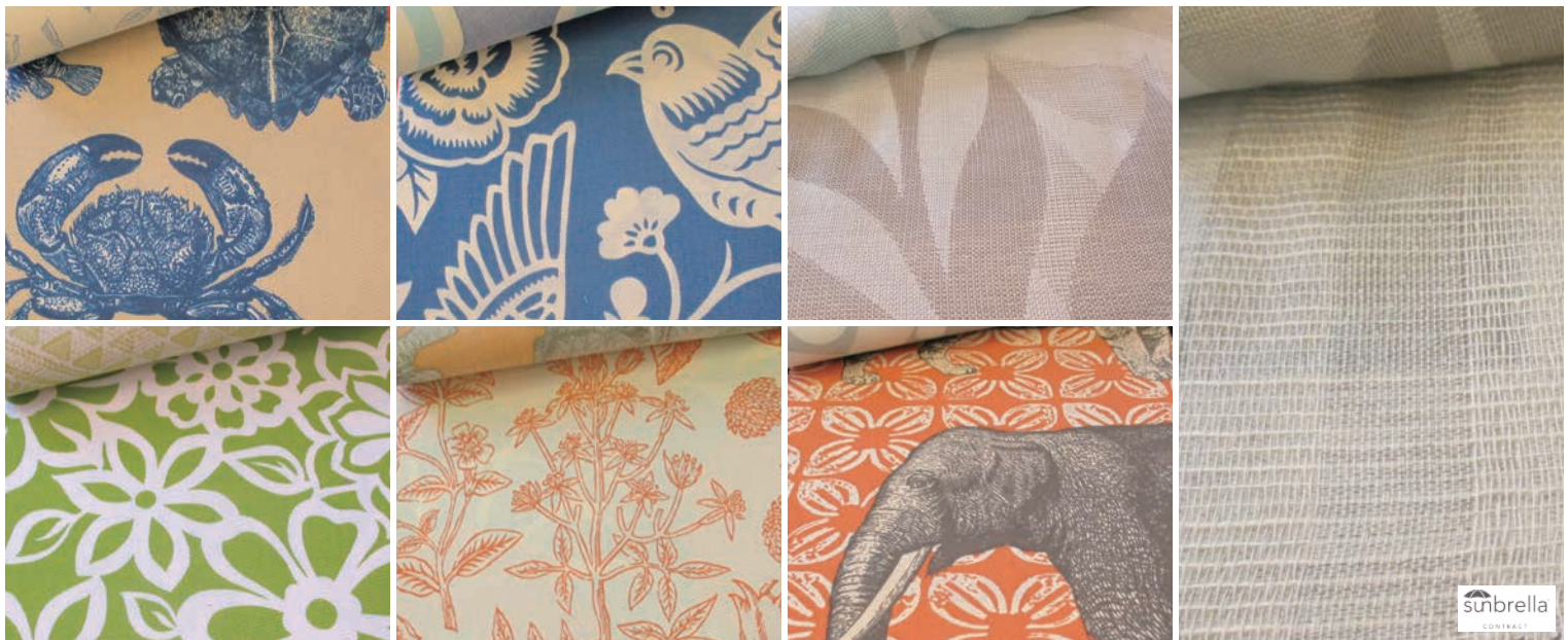
▲Duralee : Duralee ならではのポップで楽しいプリント生地は、100%アクリル地にプリントした後、撥水・褪色防止・耐紫外線・防カビ加工。アウトドア用シアーカーテンのコレクションもあり、こちらは Sunbrella 社の原着アクリル糸を使用。