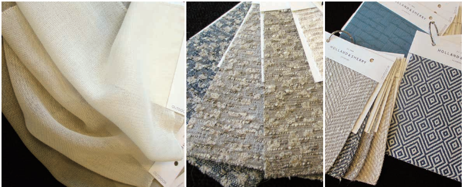
▲Holland and sherry : 100% 原着アクリルを使用したコレクションを展開。イスバリからシアーカーテンまで、テクスチャー感のあるナチュラルカラーが上品。