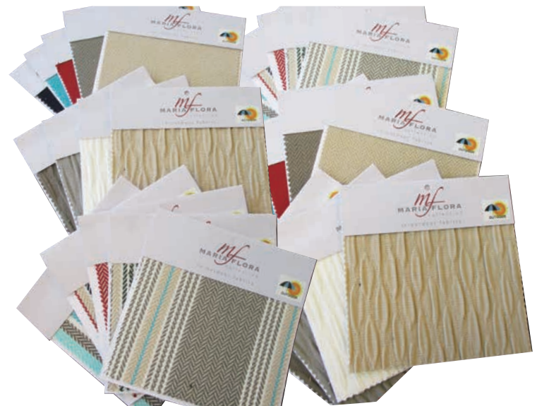
▲Maria Flora : イタリアのマニファクチャーらしく、高品質で織物らしい存在感のあるコレクションを展開。100%原着アクリルを使用。