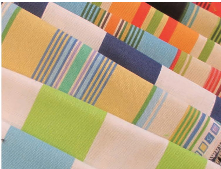
▲Trend (Fabricut) : アウトドアの定番は楽しくポップなストライプ柄。素材はポリエステルで、表面に防汚等の加工を施してアウトドアに向く仕様に。