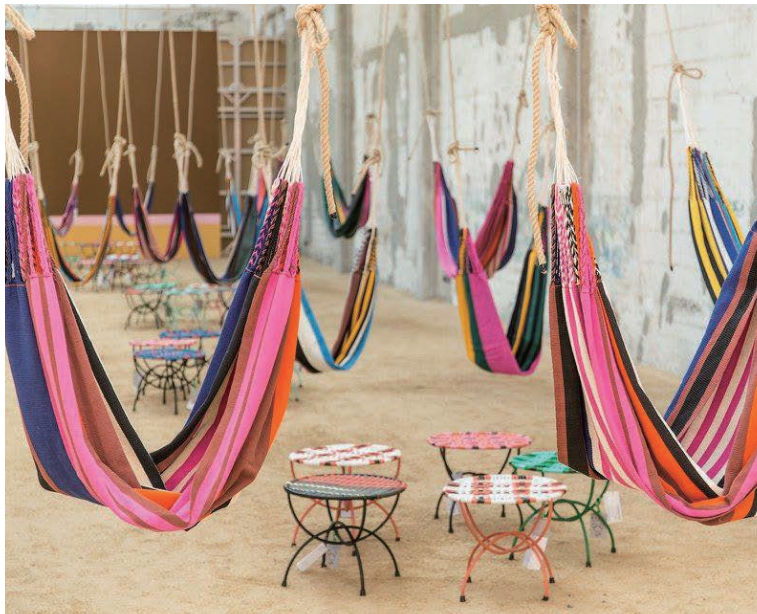
▲MARNI：伝統工芸とカラフルな色合いでラテンの風を運んで。