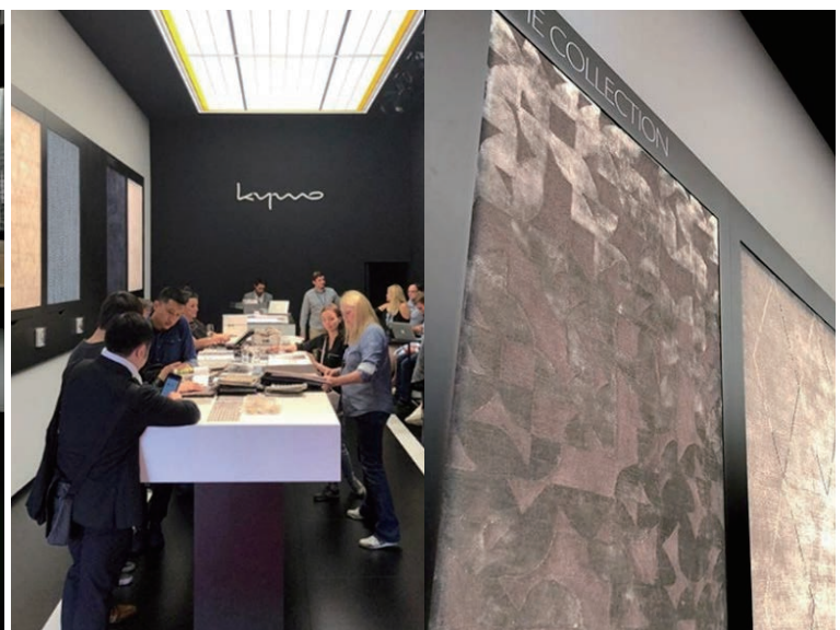
▲新しいコレクションを発表し続け、常にフレッシュなラインナップを保つ KYMO。コントラクト向けの The Artier Collection も好評です。

ミラノ市と連携して、市内では「LIVING NATURE」というサステイナビリティをテーマにした展示などを開催し、ファッションブランドによる個別のインスタレーションも盛り上がりを見せました。