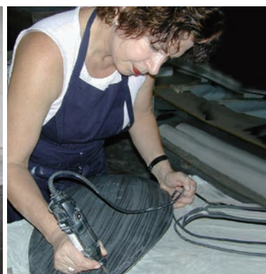
▲GARDECO : ガラスの絶妙な作品は、ブラジルのアーティスト、レジナ・メデイロスによる作品。