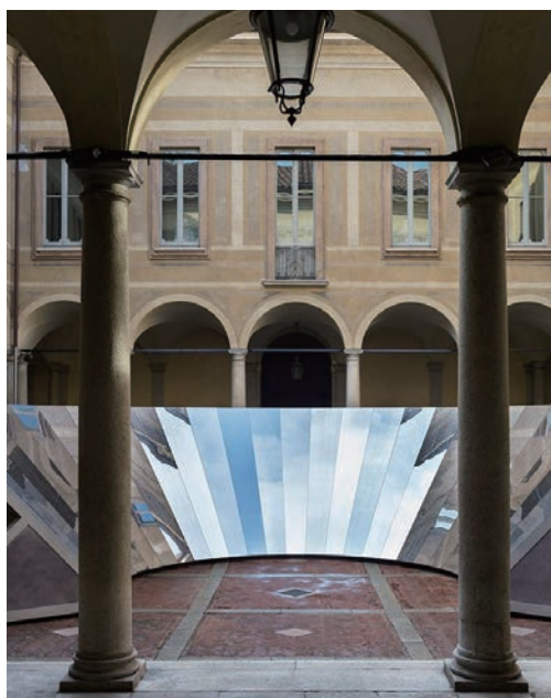
中 /COS：建造物の美しさとミラノの空の美しさを融合。