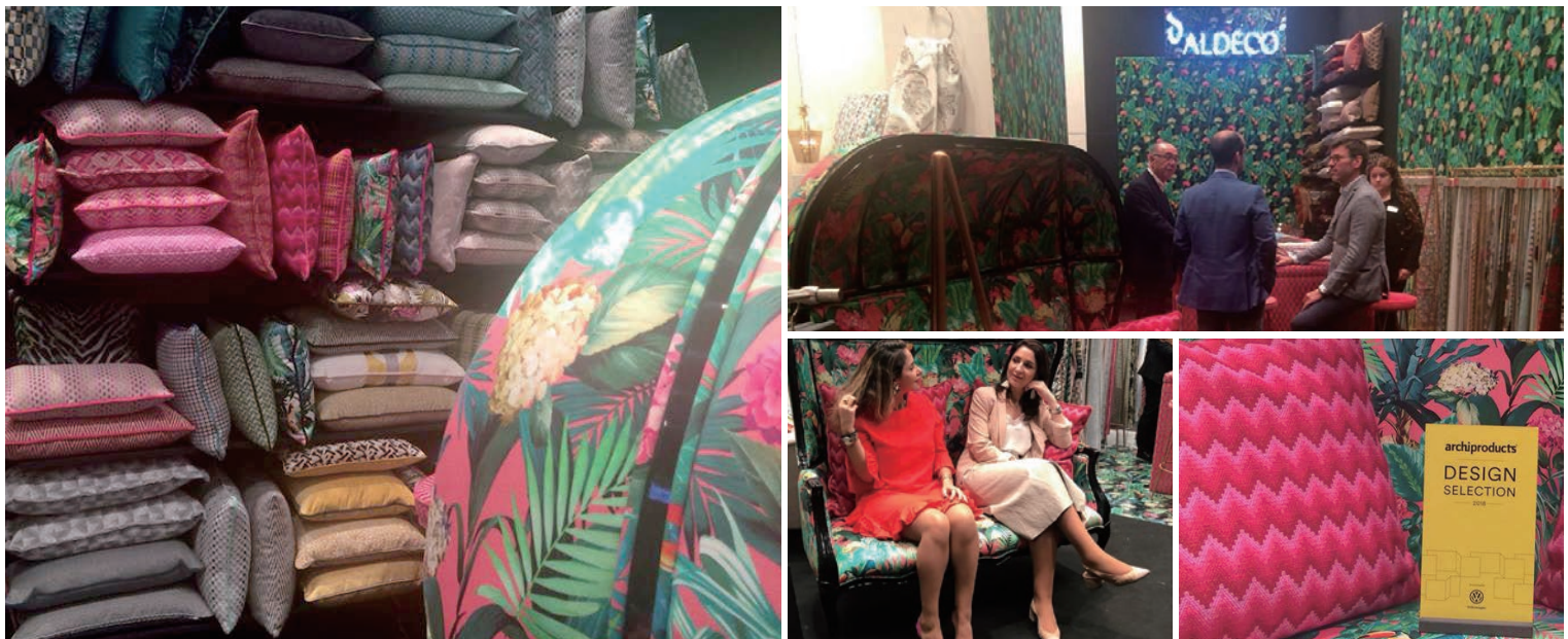
▲上：ベルギーに拠点を置く GARDECO。ユニークな作品や真摯にアートに向き合う才能あるアーティストを発掘・プロデュースする。 下：ファッションを意識したデザインを提案する ALDECO。大胆な色の組み合わせも不思議とまとまりを感じさせる。Archiproducts Design Selection 2018 を受賞。