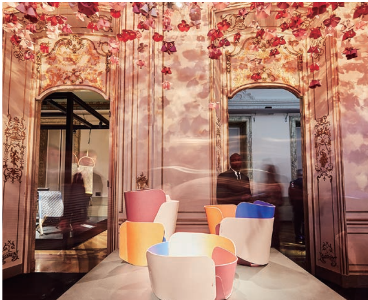
▲LOUIS VUITTON：旅をするように可能性を広げていく家具コレクション「THE OBJECTS NOMADES」。