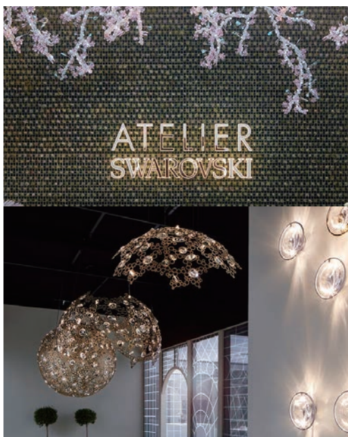
▲左 /SWAROVSKI PALAZZO：煌めきと高揚感をもたらすホームコレクションがデビュー。