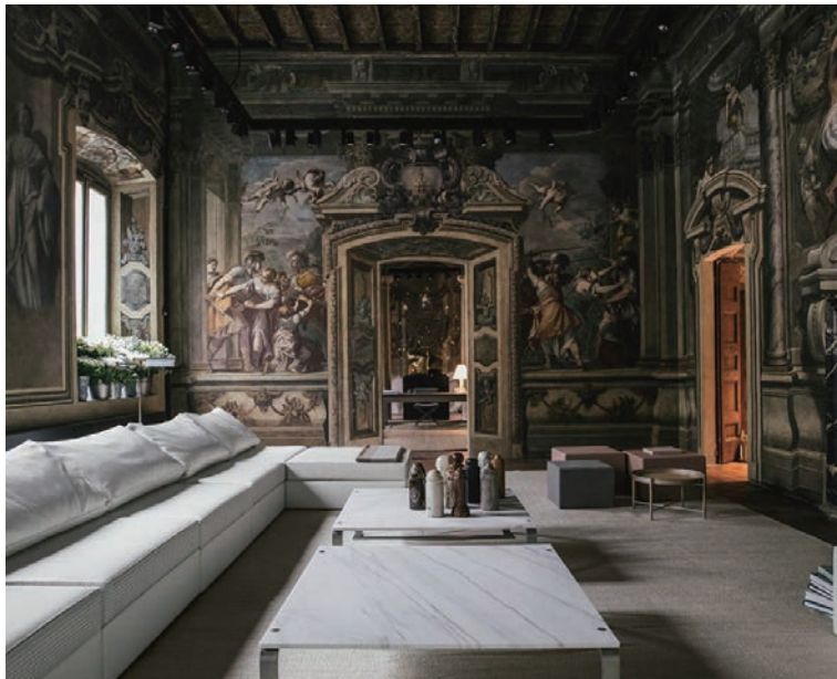
▲BOTTEGA VENETA：職人技が光るモダンな遊び心。