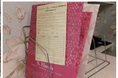
▲実物をイメージできる大判の生地、色を一覧できるボードなど、展示が工夫されている。また、奥にはサンプルのストックルームがありサンプルをその場で持ち帰る事もできる。