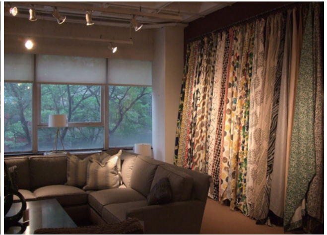
▲各ショールームは、それぞれのブランドコンセプトに沿って美しく機能的にディスプレイされ、商品が探しやすくなっている。窓の外には緑が見えたりと、長時間でも過ごしやすい空間になっている。